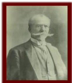
Biblioteca Central "Dr. Lisandro Segovia"